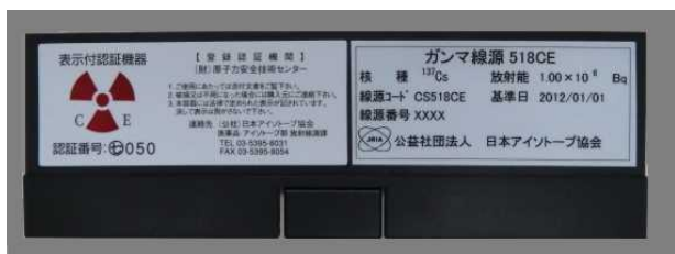
図 3 製品容器の様子（写真例）