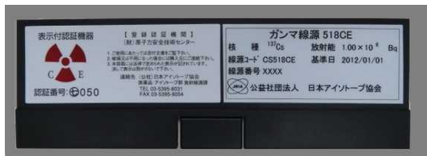
図 3 製品容器の様子（写真例）