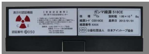
図 3 製品容器の様子（写真例）