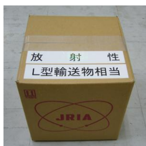
図 4 梱包形態（写真例）

本製品は必要に応じて鉛容器等を用いて遮へい措置が講じられている場合があります。また、製品と図 3 に示した製品容器が別々に梱包されている場合がありますが、開梱後は製品容器に製品を収納して頂きご使用下さい。図 4 に梱包形態の例として、梱包の外観の様子を例を示します。