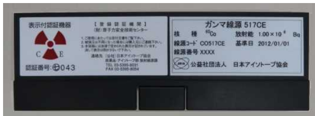
図 3 製品容器の様子（写真例）