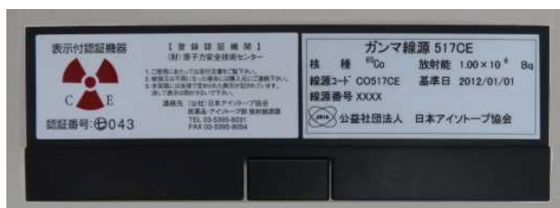
図3 製品容器の様子（写真例）