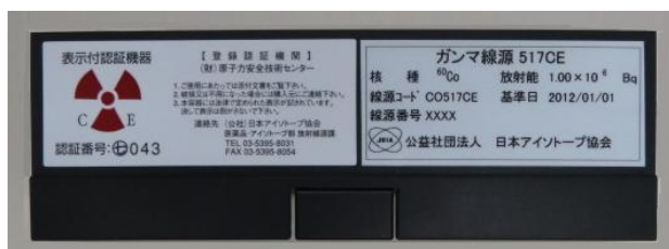
図 3 製品容器の様子（写真例）