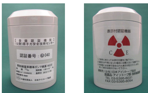
図3 製品容器の様子 (写真例)