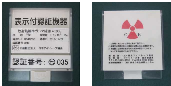
図3 製品容器の様子（写真例）