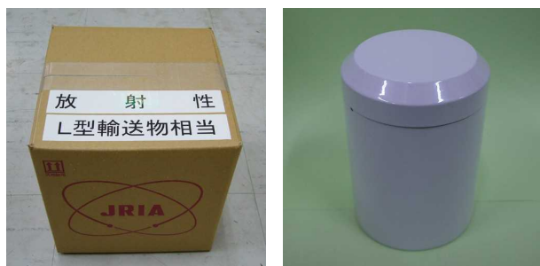
図4 梱包形態（写真例）

本製品は必要に応じて鉛容器等を用いて遮へい措置が講じられている場合があります。また、製品と図3に示した製品容器が別々に梱包されている場合がありますが、開梱後は製品容器に製品を収納して頂きご使用ください。図4に梱包形態の例として、梱包の外観の様子と遮蔽に使用する鉛容器の例を示します。