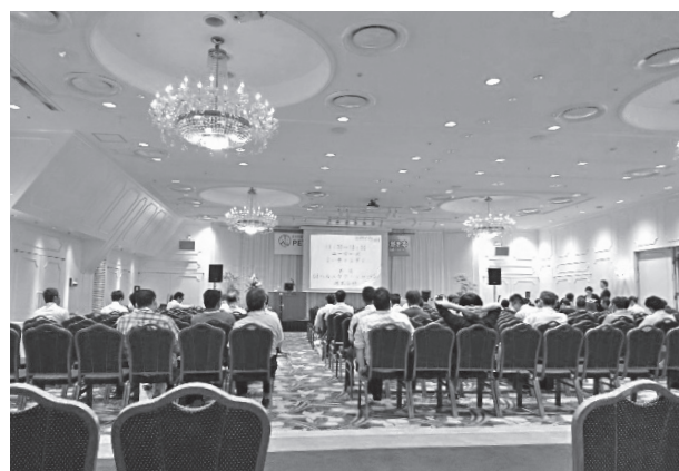
写真2 会場内の様子