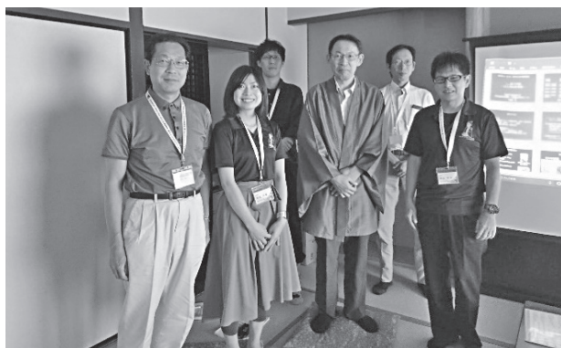
写真3 ミニ松下村塾にて 塾長（筆者）と塾生のみなさん

な職種の立場からの視点を知るよい機会となりました。このような企画はまさにPETサマーセミナーならではの企画だと思います。