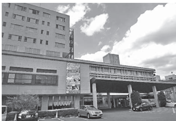
写真1 会場の山口県湯田温泉・ホテルかめ福

セミナー2日目の午前は、臨床、看護、技術、薬剤等の各領域の講演形式のセッションが組み立てられており、筆者は看護のセッションを聴講しました。PET検査における看護上の問題点や工夫、苦労話等を聞くことができ、医師の立場からもとても勉強になりました。セミナー2日目の午後は、大会長横断企画として、全職種による「皆で築くより良いPET検査」が組み立てられていました。医師、看護師、診療放射線技師、薬剤師、製薬メーカーの立場から、PET検査における問題点やその解決策等が発表され、いろいろ