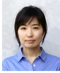
東京大学 大学院農学生命科学研究科