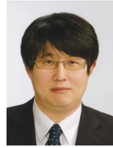
量子科学技術研究開発機構 量子ビーム科学部門 高崎量子応用研究所