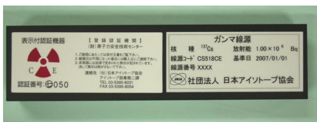
図 3 製品容器の様子（写真例）