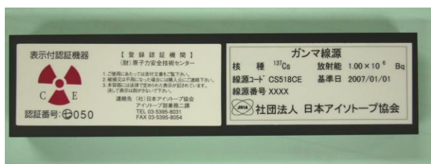
図 3 製品容器の様子（写真例）