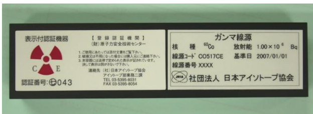
図 3 製品容器の様子（写真例）