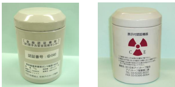
図 3 製品容器の様子（写真例）