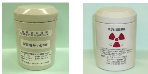
図 3 製品容器の様子 (写真例)