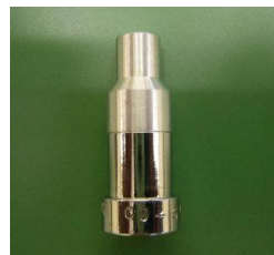
図 1 外観図 (写真例)