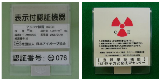
図 3 製品容器の様子（写真例）