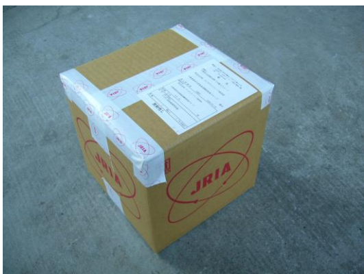
図 4 梱包形態（写真例）