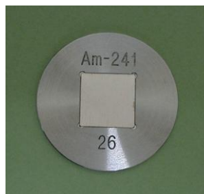
図 1 外觀図 (写真例)