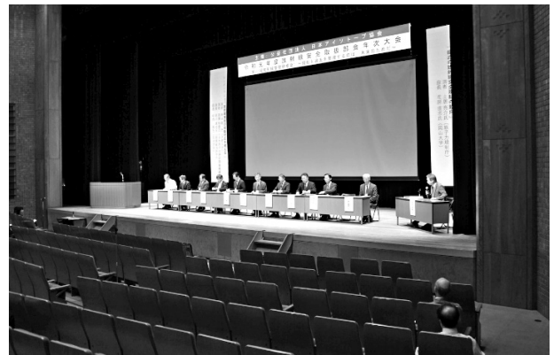
写真1 部会総会風景

本大会での試みとして、ひとつは大会開始時間を12時20分からとしました。これは会場の都合で前日準備ができないための措置でした。そのため、昼食時間や相談コーナーの設置時間等にしわ寄せが行き、ご不便をおかけした面もありましたが、遠方からは当日移動が可能となり参加しやすくなったとの意見もいただきました。また、交流会では、恒例の出しものに加え、実行委員によるクイズ大会を行いました。これも確保できた会場の制約が理由の変更でしたが、反響はまずまずだったように思います。更に、本大会では前回に習いプレイベントとして10月23日に人形峠環境技術センターの見学会を行