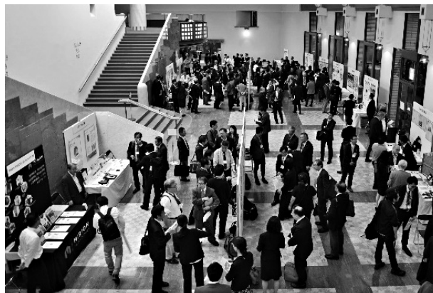
写真13 ポスター発表会場の様子

本大会実行委員11名からなる審査員の採点により、次のとおり、最優秀賞1件、優秀賞2件が選出された。