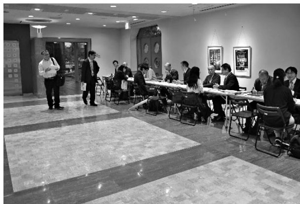
写真 15 相談コーナー

今年の交流会は年次大会会場近くのホテルで開催された。参加者は定員上限の158名であった。会場が狭いため、地下にある会場の廊下や別室も使用した交流会となった。会場のスペースの都合で参加で