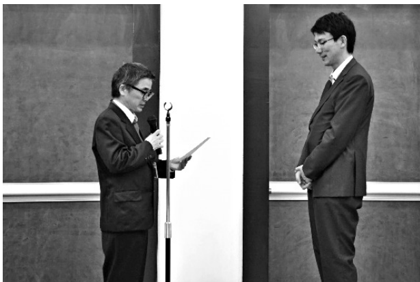
写真 14 ポスター発表表彰の様子

に不在というハプニングが一部には生じたものの、予期せぬ吉報に、なかば驚きつつ壇上に立った受賞者には、会場から惜しめない拍手が送られていた。 (写真 14)