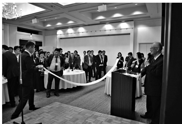
写真17 交流会(はだか祭の締込)

からも遠いため、貸切バスで移動した。岡山駅を9:50頃出発し、12:20頃に人形峠環境技術センターに到着した。