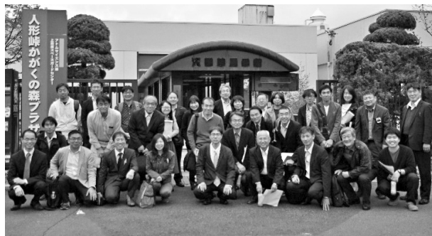
写真 18 人形峠環境技術センター見学会

鉱さい堆積場は、人形峠の鉱山としての施設で、ウランを分離した後の残渣を貯蔵するほか、処理前の坑水を貯留する役割があるとのことだった。ここでは、人形峠の地層調査の際に得られたボーリングコアを見ることができ、礫岩層に含まれたウ