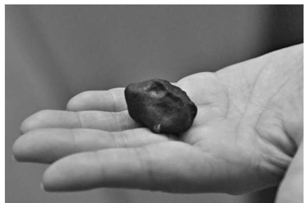
写真 5 チェリャビンスク隕石